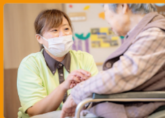
意欲的な職員を応援してくれる職場

専門学校で医療事務を学んだ後、看護補助として「中嶋病院」に入職しました。食事介助やシーツ交換といった業務をする中で、「もっと入院されている方に寄り添ったケアをしたい」と、実務者研修の資格に挑戦。上司には、「スキルアップをして高齢者福祉施設で働きたい」と伝えていたので、資格取得後はすぐにグループの介護老人保健施設へ異動することができ、さらに勉強をして介護福祉士の資格を取りました。看護補助をしていたおかげで利用者のちょっとした体調の変化にも気づくことができ、入職してからのすべての経験が今に活かしていると感じます。まずは、介護福祉士として一人前になって、将来的にはケアマネージャーや支援相談員へのステップアップも考えています。