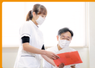
仲間同士で助け合っています

私の仕事は、診断書の作成や診察記録の入力といった医師の事務的な作業の補助を行う「医師事務作業補助」。診療は医師にしかできませんが、私たちがサポートすることで、医師と患者さまが向き合う時間を増やしています。私の場合、看護補助として入職し、外来を経験したのち今の部署に配属。11名いる仲間の中には、医療とは関係のない仕事から転職した人もいますが、この職種は資格がなくても大丈夫。院内外の研修があり、経験を重ねて知識を身につけられます。また、ここは女性が働きやすい職場です。私自身、子育てをしながら働くママ。院内保育園のおかげで待機児童の心配もなく、育児休暇中は子育てに集中できました。育児だけでなく、家族の介護をしている人も安心して働ける環境があります。